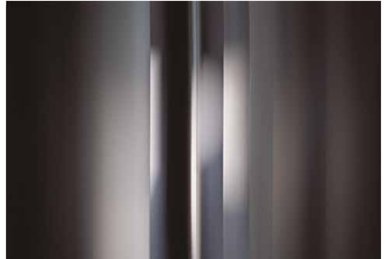
from Hiroshima #01, 100x150 cm, archival photographic paper, facemount.

Møtet med "De andre" har gjennom kunsthistorien, så vel som i annen forskningshistorie, endret karakter og metode. Mens de første kunstnerne som oppsøkte fremmede kulturer gjerne var mest opptatt av naturen og menneskenes livsforhold sett ut fra parametere som romantikk og symbolisme, ser man i dagens samtidsuttrykk en mer fremtredende kritisk diskurs. I dette bildet fremkommer et paradoks. Mens tidligere tiders kunst blant annet ble betegnet som degenerert eller vulgær og derigjennom mottatt med skepsis på hjemmebane, ser man i dag en reversering av