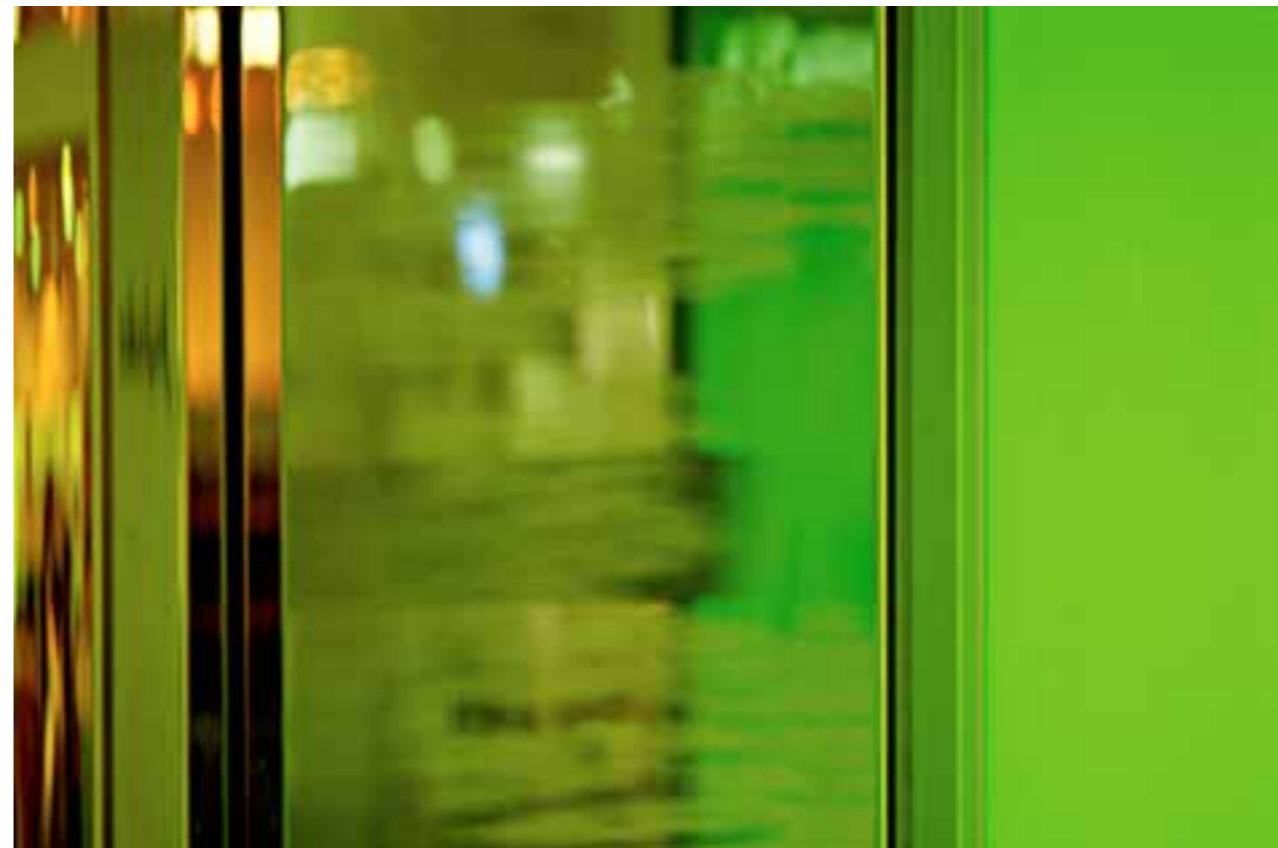
from Tokyo #14, 100x150 cm, archival photographic paper, facemount.

Mens det å reise til fremmede områder på 1800-tallet var å betrakte som krevende ekspedisjoner er avstanden til de fleste destinasjoner enkel å overkomme i dag. På dette grunnlaget skulle man kanskje tro at interessen og nysgjerrigheten på ”De andre” ikke var av like stor betydning lenger. Dessuten kan man i stor grad også til egne seg kunnskap med ett par tastetrykk via internett eller TV. Dette er imidlertid en feilslutning. Mulighetene for å reise har snarere stimulert anledningen til fordypning i fremmede kulturer - også på kunstens premisser. Blant kontemporære norske