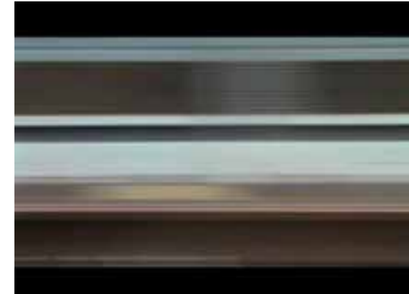
Video: Koyoto - Tokyo 2:50 min loop. 2007 SYNOPSIS: Mønsteret sett på utsiden av togvinduet.